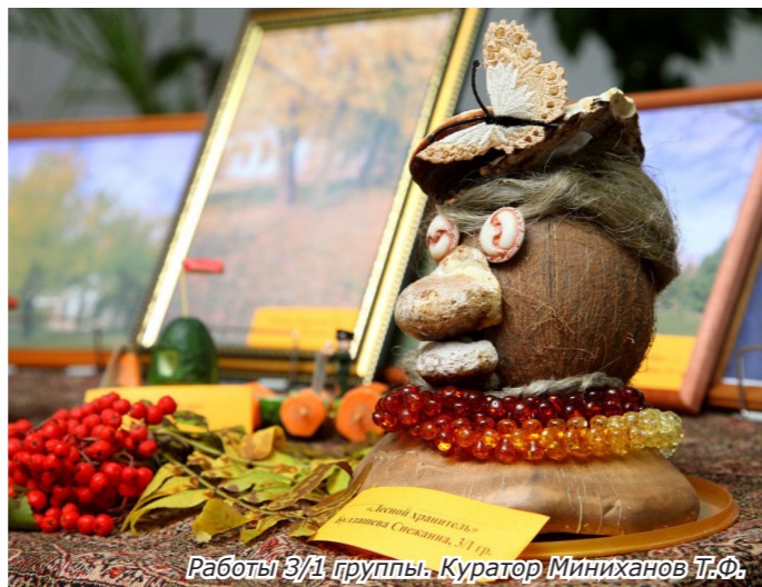
Работы 3/1 группы. Куратор Миниханов Т.Ф.