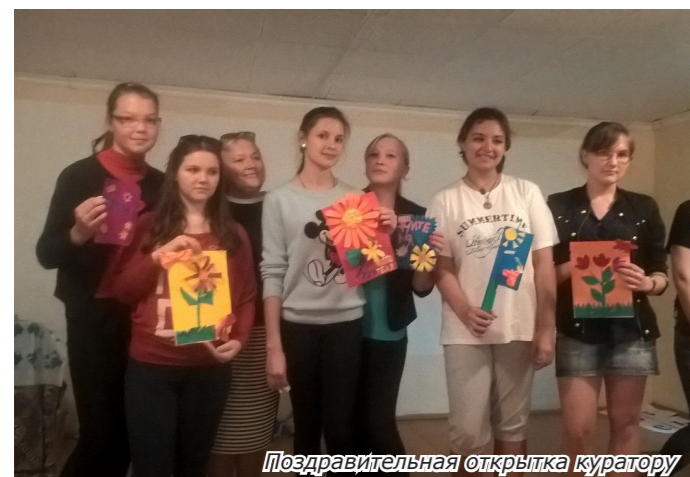
Поздравительная открытка куратору