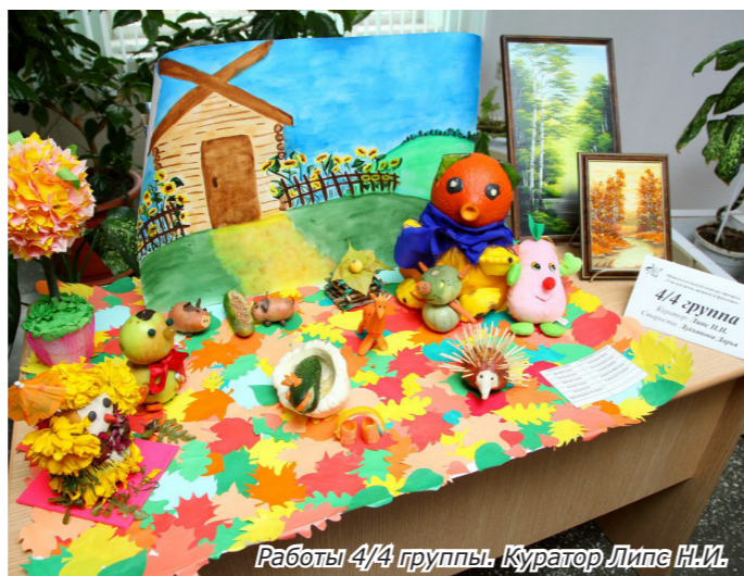
Работы 4/4 группы. Куратор Липе Н.И.