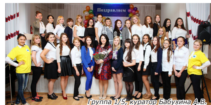
Группа 1/5, куратор Бабухина А.В.