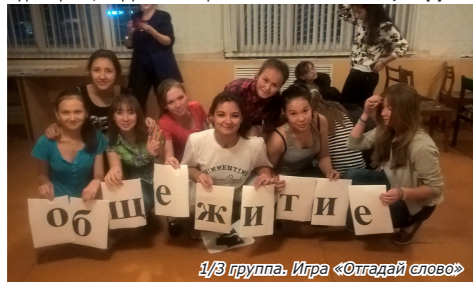
1/3 группа. Игра «Отгадай слово»