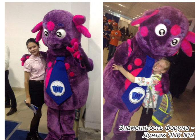
Знаменитость форума - Лунтик ЧПК №2