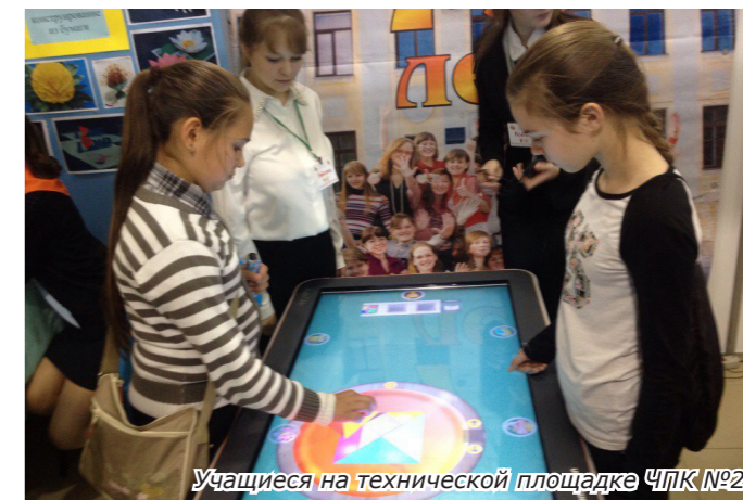
Учащиеся на технической площадке ЧПК №2