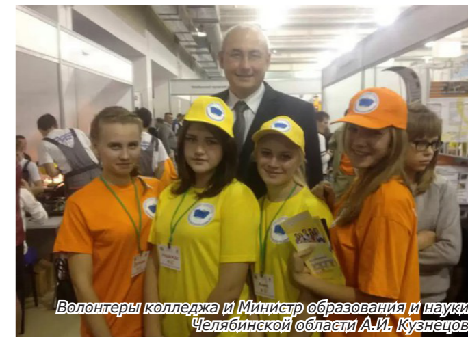
Волонтеры колледжа и Министр образования и науки Челябинской области А.И. Кузнецов