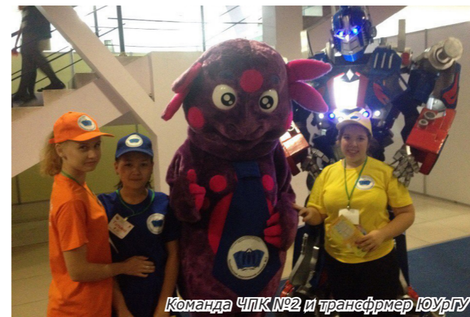
Команда ЧПК №2 и трансформер ЮУрГУ